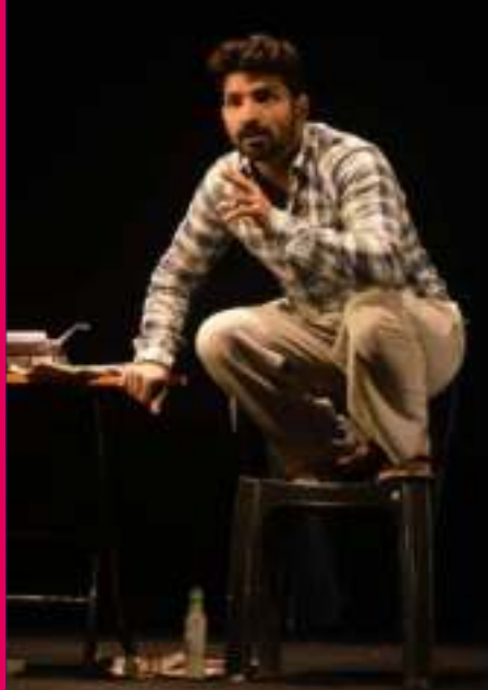
Actor Jatin Sarna in play Khidki at Parwaaz 2023