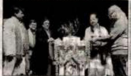
Paulity recovery parsent at, padd and

परक (एकपुनक्षे) । प्रश्नुनिक समा उर्वेनोका का त्राव जनगङ्गि गाउँ