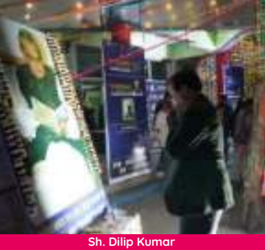
I.R.T.S. Special Secretary, Dept. of Industries, Bihar