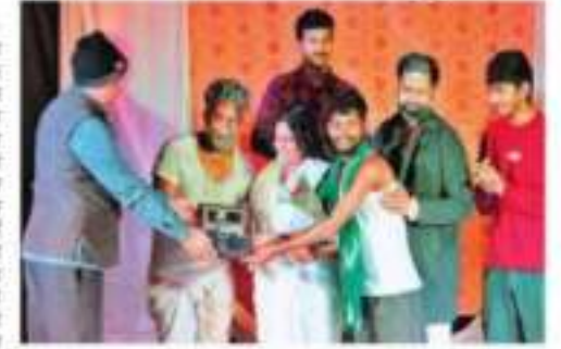
हुए अन्तर्भ के राजने कुमका मेर्ड हुए हैं. केटब में पहाड़ का भी थी। या तरका आबाब रिकालर्ड में कि ऐसे करोब पाय और अंदर मेंद्र मेंद्र कार कीर्ड कुमिया कारा उसके मुंद्र से ऐसे दिन डिला देने वाली. तरेने मेंद्र गर्दी मो या मेंद्र अहरीक सकते.

अंध्यूष्टि ग्रॅक्टरम भारत सरका के स्तुर्यात से जिल्हे के परित्तु नेरकार्ते रूप, अस्तिक रित्तारी को सम्बन्धि पत्र दिल्लीम समुद्रिय econ country on the stellar sention (स्पूत इस किया का सा है। इस स्वा रिवारीय अपनेतन में 21 नककर की रात की क्षेत्रिकेशन, पटच, बिडार भी अनुहर सकन नाक का नंबन दुआ। किएको निर्देशन कुंदर कुंबर ने किया है। नाटक के पूर्वता में रिग्रुत की प्रश्नाति काराज का नेतल किया एक निरामा विदेशन मुख्य करताला सुध्या मंत्रे र सिक्ष है। नहके बचन नहके की बनावें को सुबारत स्रोतहे के हुए में होते हैं वर्क पर बार और बेटा दोने तक मुझे