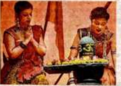
प्रेमक्ट राजाना में बाटक 'हुआ' की इस्तुवि के दीवन मह पर कलावार.

नटक दूरी की करानी अक्षणानी सर्व को काली के अतिम बार को एउन्होंने में रचा-बसी की सर नटक एक ऐसे दूरी की करानी करता है जिसके लिए ह रायांत्र, बलिका से सर्वोची या