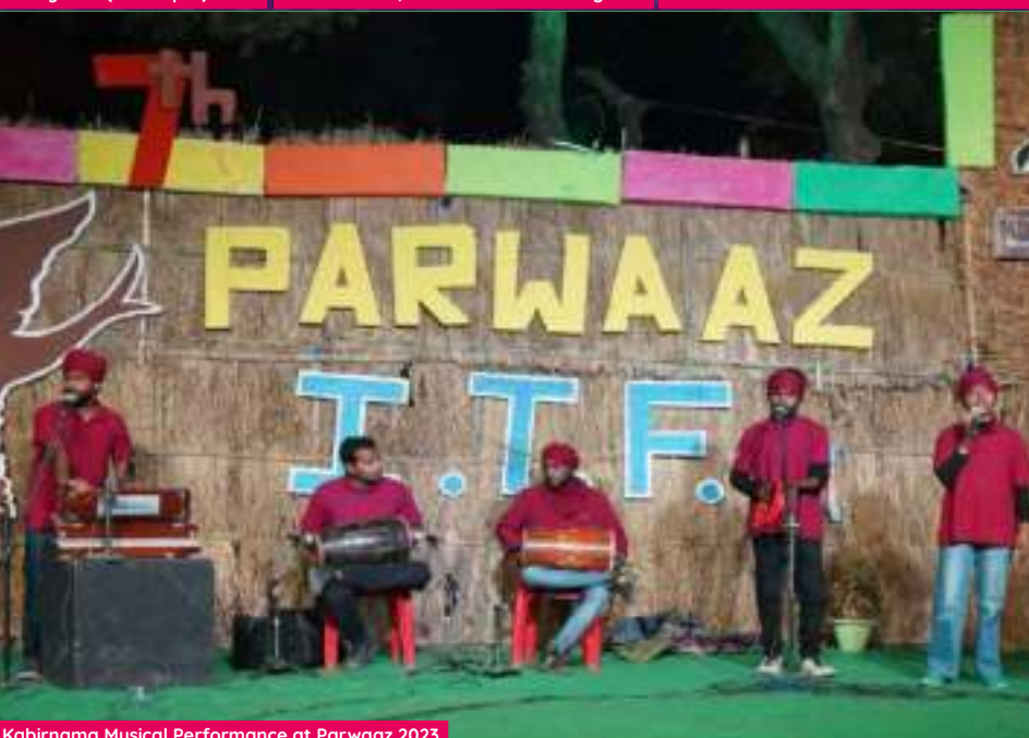
Kabirnama Musical Performance at Parwaaz 2023