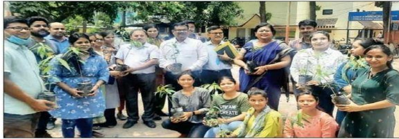
पौधरोपण कार्यक्रम में हिस्सा लेने वाली छात्राओं के साथ कॉलेज के शिक्षक और शिक्षिका।